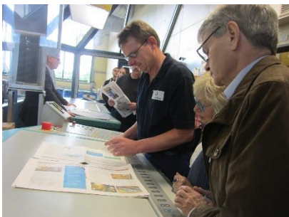
Die ersten gedruckten Exemplare werden kritisch geprüft.