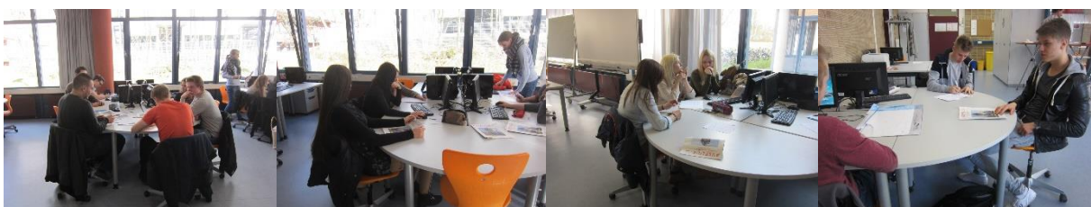
Schüler und Schülerinnen der HB15B tauschen sich in Kleingruppen über ihre gewählten Themen aus.