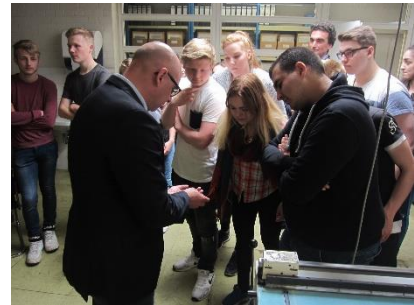
Die Schülerinnen und Schüler betrachten Lettern, die bis zur Einführung des Foto-drucks verwendet wurden.