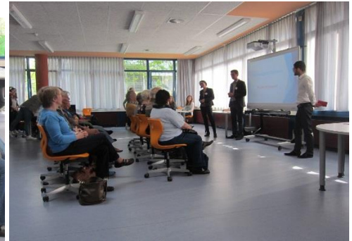
Die Begrüßung und die Einführung