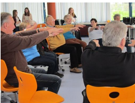
Impressionen von der Pause: Dehn- und Entspannungsübungen