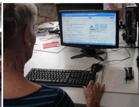
nach der Pause: Recherche im Internet