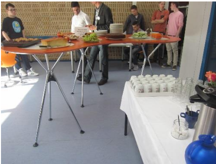
Das Buffet für die Pause