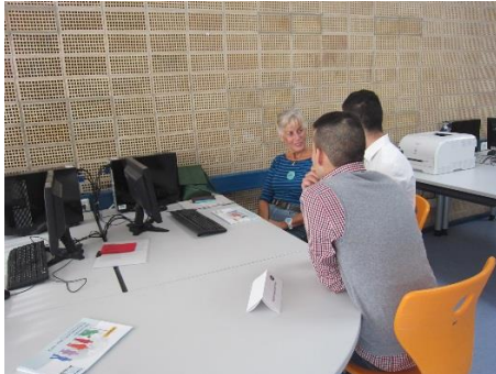
Impressionen von der Zusammenarbeit: Gespräche und Arbeit am PC