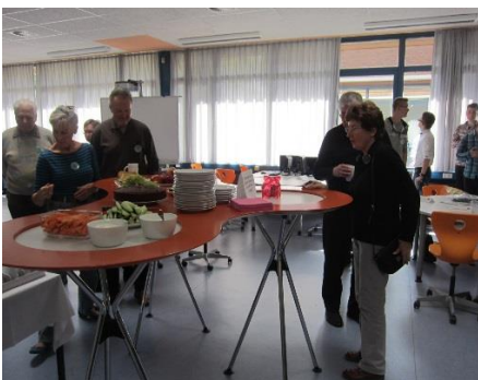
Gespräche am Buffet