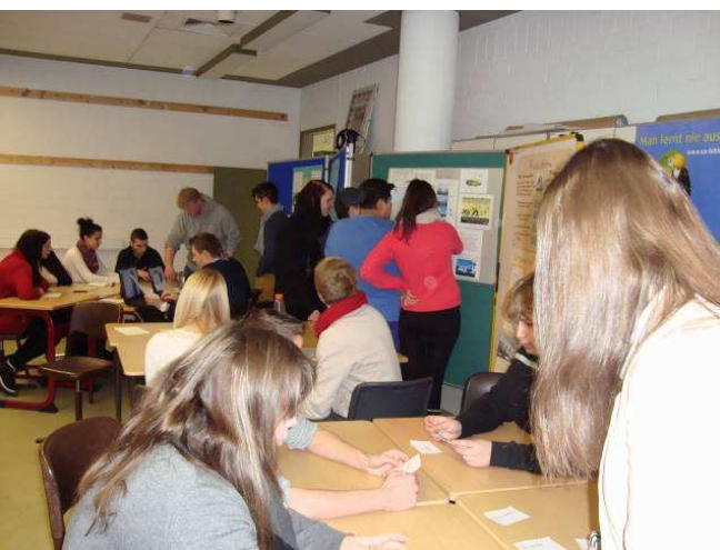
Von vorne nach hinten betrachtet: Station „Tierversuche“,