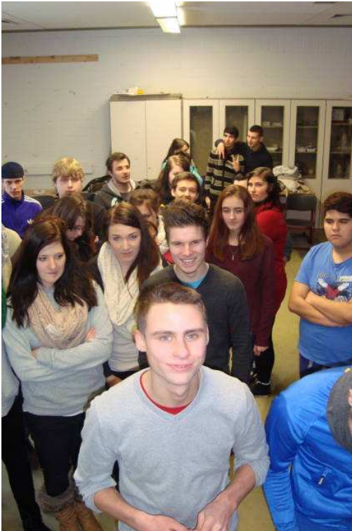
Bewertung der Stationen