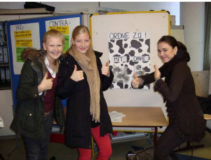
Schülerinnen der BG 11C mit ihrer Station „Tierversuche“