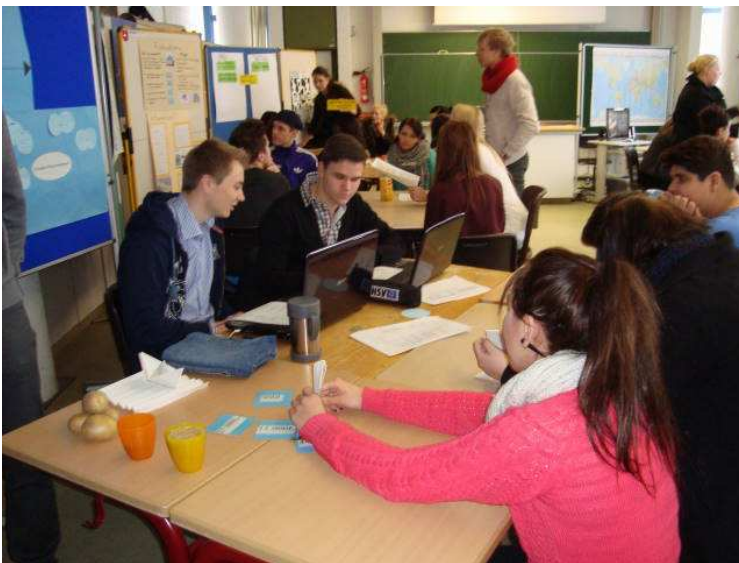
Station „Virtueller Wasserverbrauch“