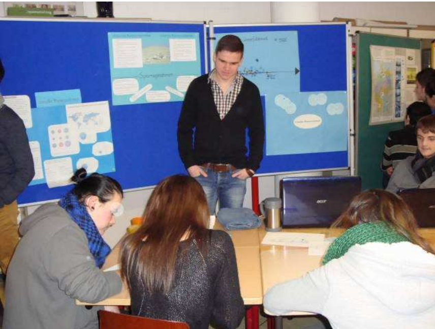
Station „Virtueller Wasserverbrauch“