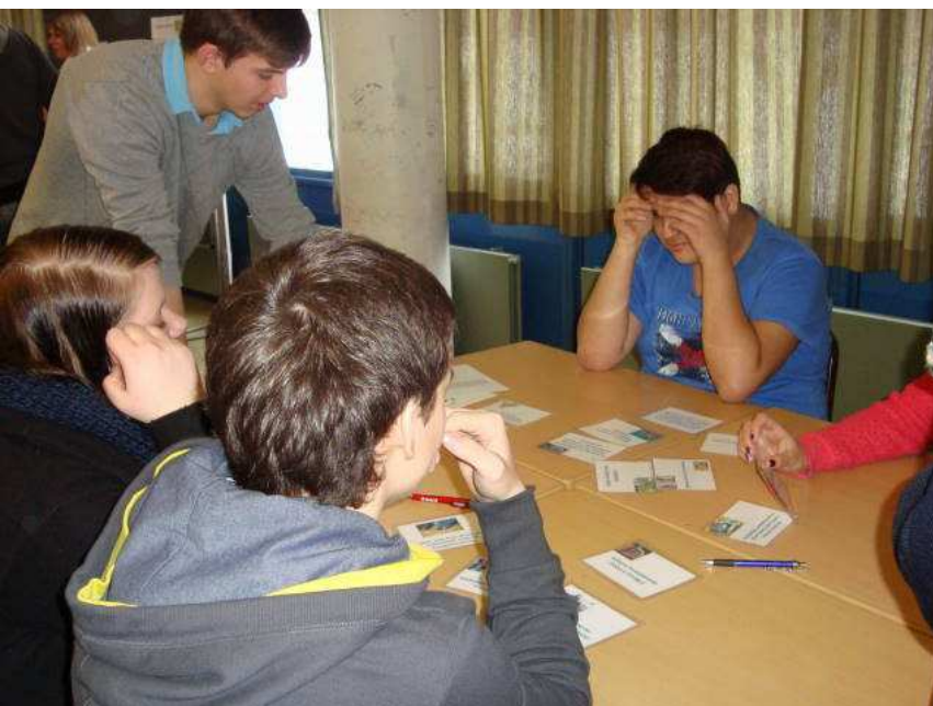
Station „Genmanipulierte Lebensmittel“