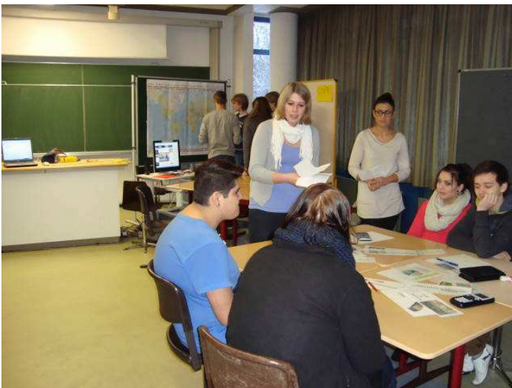
Station „Strom“ vorne, Station „Sofortness“ hinten