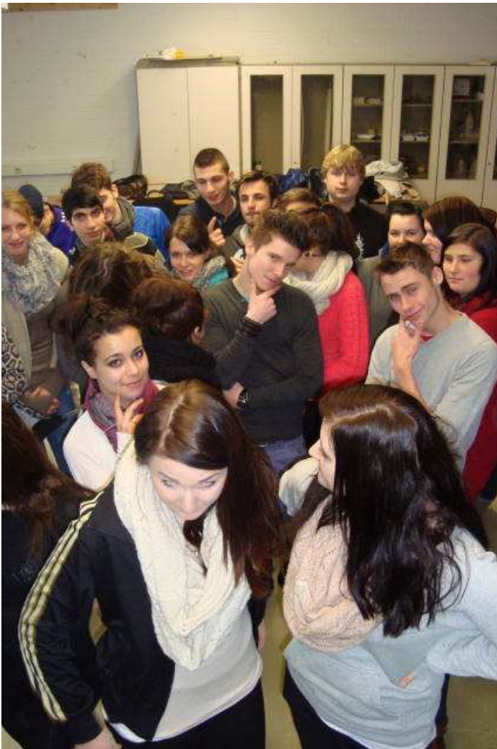
Bewertung der einzelnen Stationen durch die Christianischüler (je besser die Station, desto mehr Schüler stehen vorne)