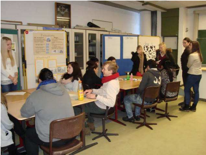
Station „Atomkraft“ vorne, Station „Tierversuche“ hinten